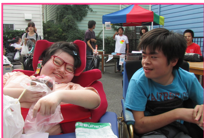
〈おまつり：等身大のひとコマ〉