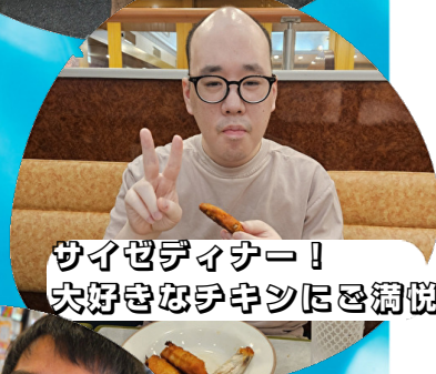
サイゼダイナー! 大好きなチキンにご満悦