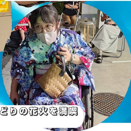
花火大会で色とりどりの花火を満喫きれいだね〜