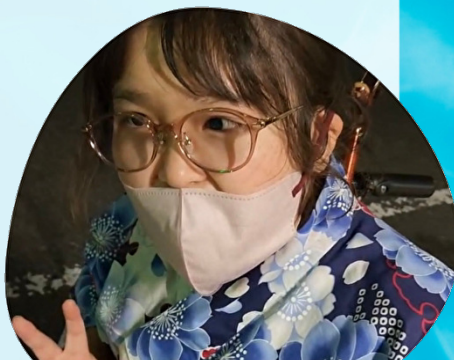
ちょっと暑いけど夜のお出かけは特別感がありますね