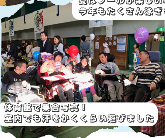
体育館で集合写真! 室内でも汗をかくくらい遊びました