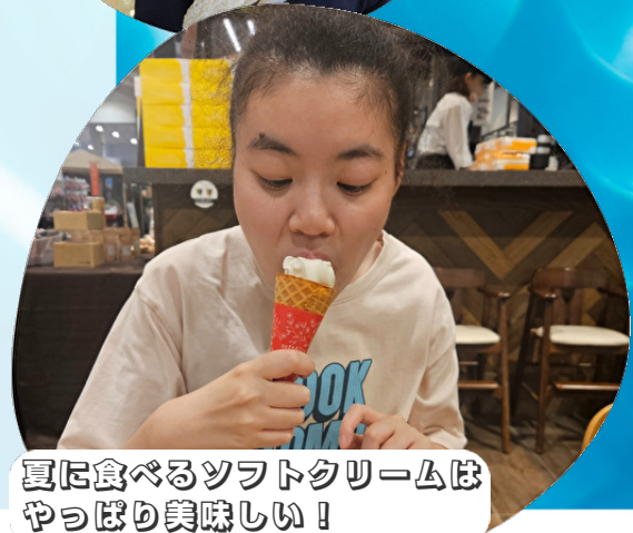
夏に食べるソフトクリームは やっぱり美味しい!