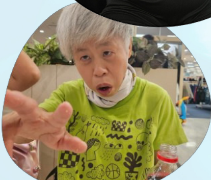
涼しい店内でつめた〜いヨーラこれぞ夏の過ごし方！