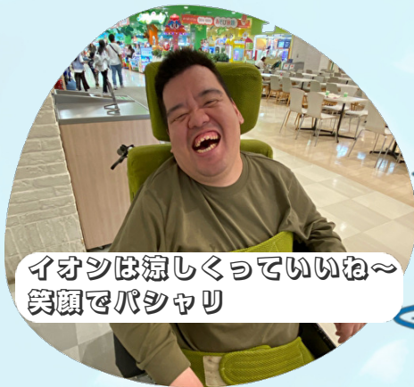
イオンは涼しくっていいね～ 笑顔でパシャリ