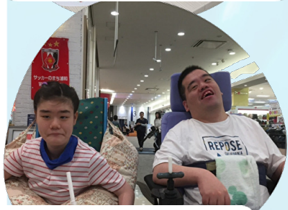
みんなでお昼を飯!