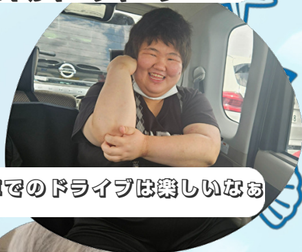
涼しい車でのドライブは楽しいなあ