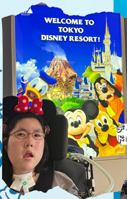
ディズニーリゾートラインに乗車ドキドキわくわくの旅です！