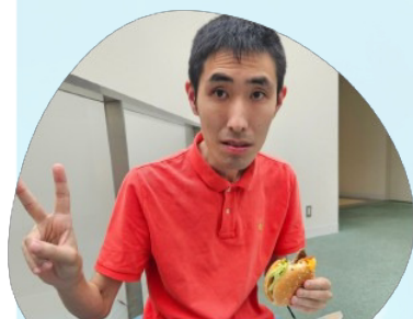
暑い夏に負けないように、大好きなマックでエネルギーチャージ