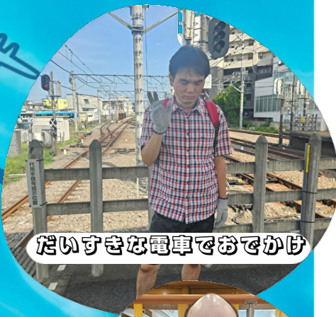
だいすきな電車でおでかけ