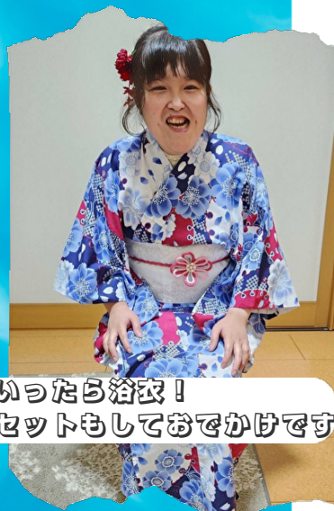
夏といったら浴衣！ヘアセットもしてお出かけです