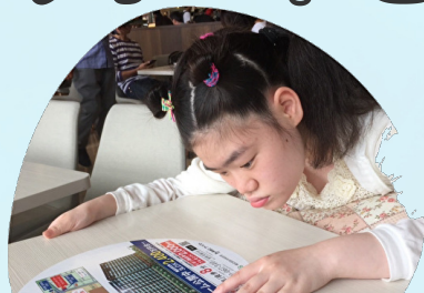
なににしようかな～選んでいます