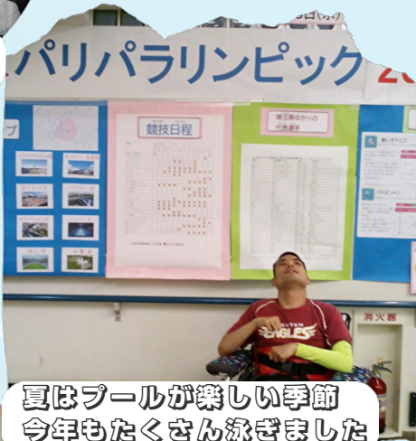
夏はプールが楽しい季節 今年もたくさん泳ぎました