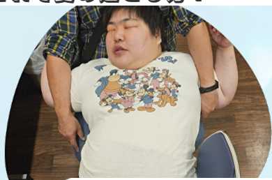
涼しい部屋で大好きな職員のうで枕で気持ちよく寝ています